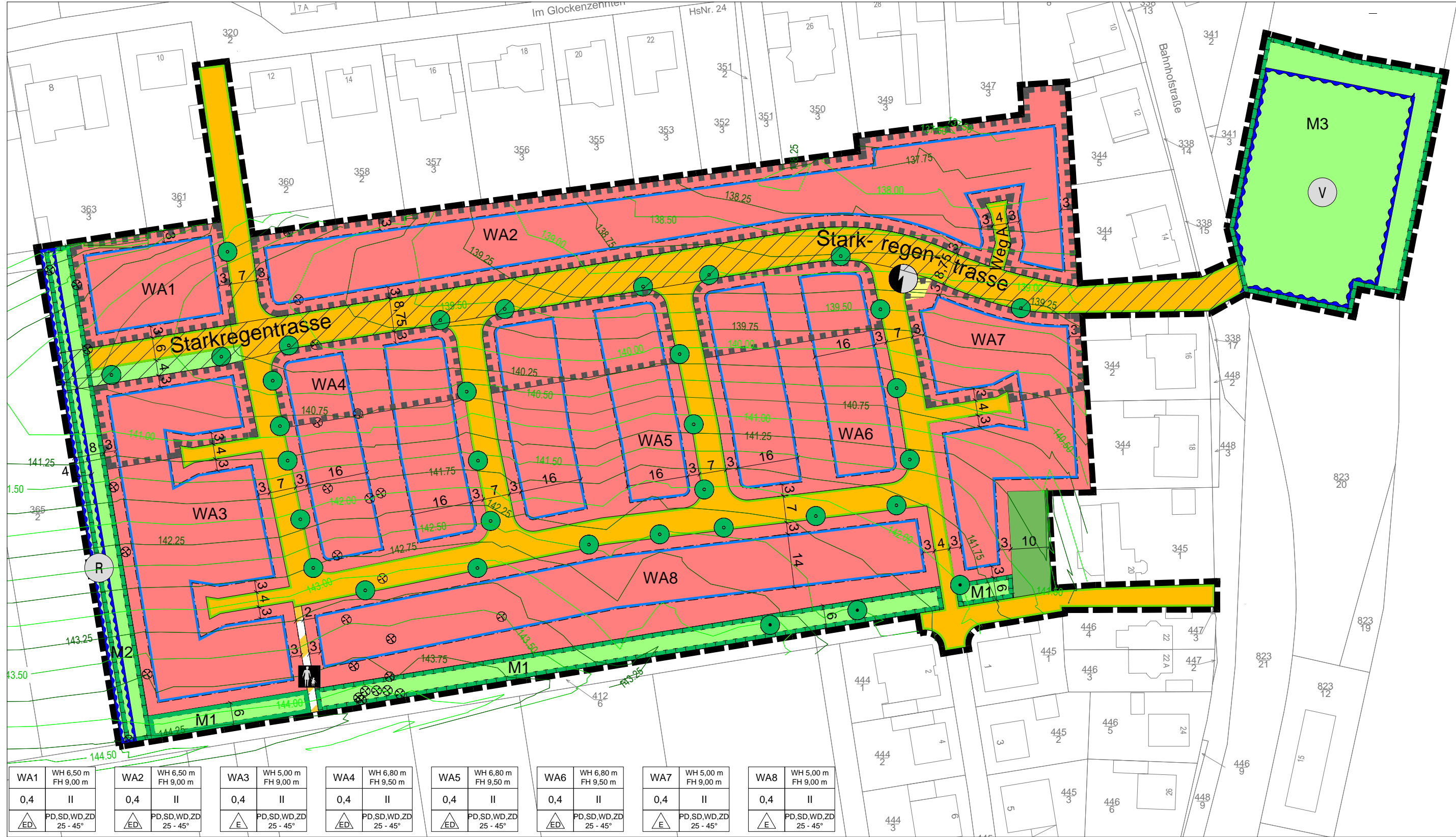
Externe Ausgleichsmaßnahme (M ca. 1 : 20.000)